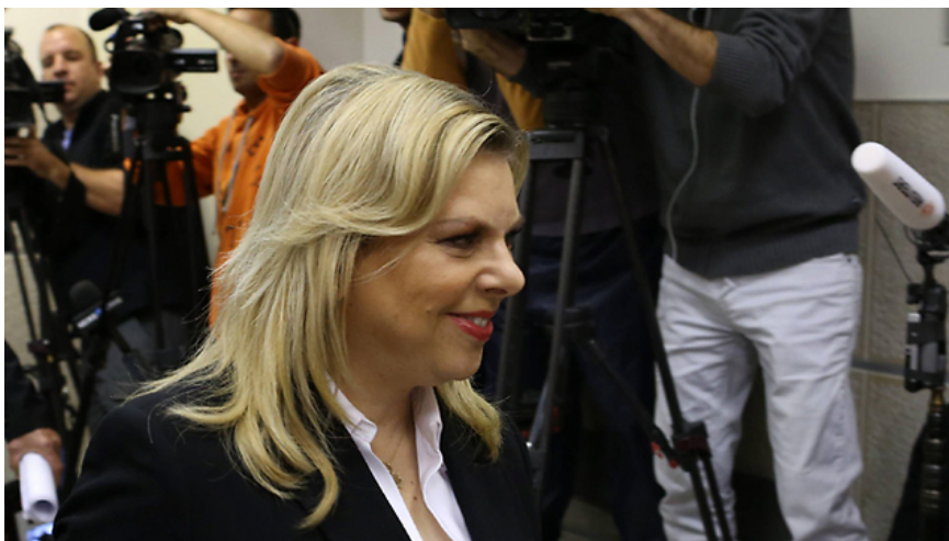
שרה נתניהו